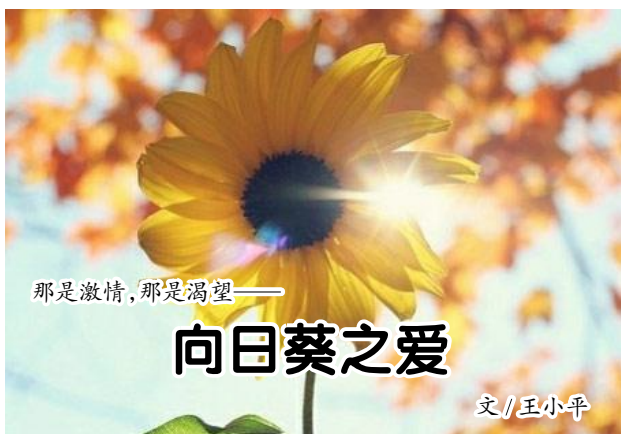
那是激情,那是渴望——