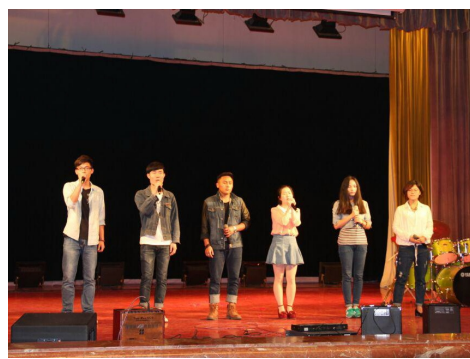
(我院参赛者正在表演)

本次不插电音乐节不仅丰富了校园文化,给民大学子带来了全新的音乐体验,还激发了广大音乐爱好者的音乐梦,促进了校园乐队和歌唱爱好者成长。